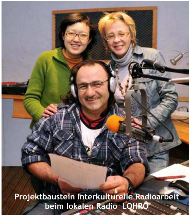
Projektbaustein Interkulturelle Radioarbeit beim lokalen Radio LOHRO

Dieses Projekt richtet sich sowohl an zugewanderte als auch an einheimische RostockerInnen. Ziele sind auf Seiten der Zugewanderten eine bessere Orientierung in der neuen Heimat, mehr Kontakte mit Einheimischen und eine aktivere Teilhabe am gesellschaftlichen Leben. Einheimische RostockerInnen bekommen die Möglichkeit, sich einem interkulturellen Training bzw. Coaching fortzubilden.